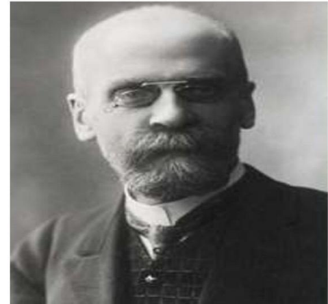
Эмиль Дюркгейм (1858-1917)